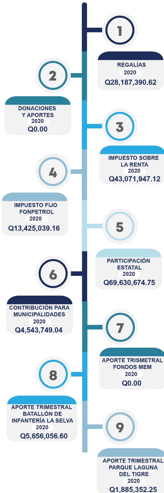
FIGURA 4 RESUMEN GENERAL DE PAGOS DE LA INDUSTRIA DE HIDROCARBUROS CORRESPONDIENTES AL PERÍODO FISCAL 2020