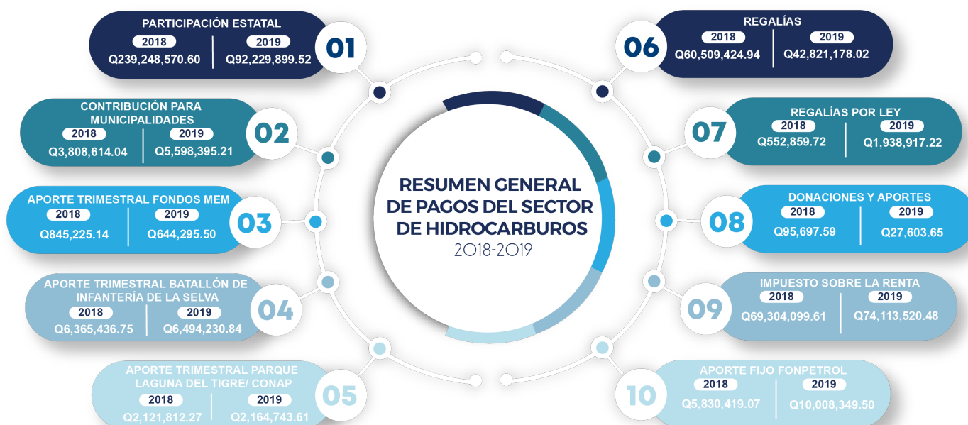
FIGURA 2 RESUMEN GENERAL DE PAGOS DEL SECTOR HIDROCARBUROS, AÑOS 2018 Y 2019

A continuación, se presenta una gráfica que resume los pagos de la industria de hidrocarburos, correspondiente al período fiscal de los años 2018-2019.