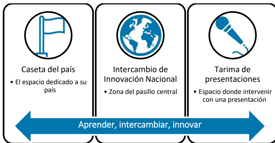
Diagrama 1: Componentes del Intercambio de Innovación Nacional 2019