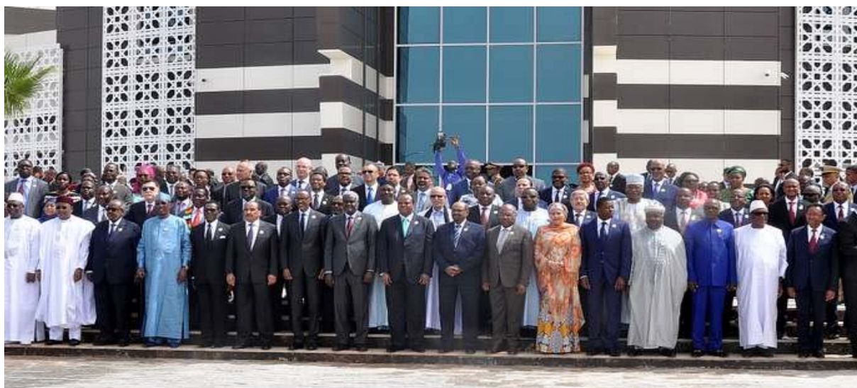
Sommet des chefs d'Etat africains lors du 31 ème sommet de l'Union Africaine, à Nouakchott, le 1 er juillet 2018 consacré à la lutte contre la corruption en Afrique

Ce tableau récapitulatif retrace l'historique et l'évolution de la mise en œuvre de l'ITIE en Mauritanie :