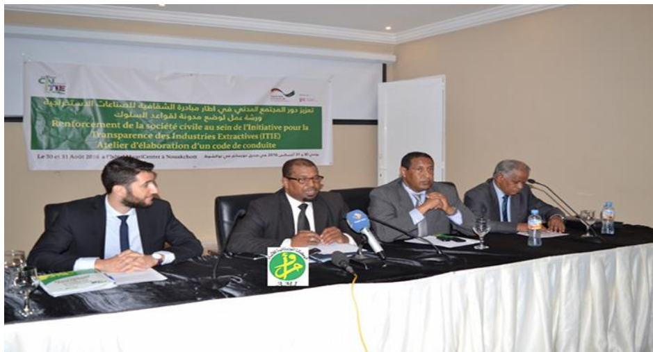
Atelier d'élaboration d'un code de conduite de la société civile au sein de l'ITIE à l'hôtel Mauricentre le 30-31 aout 2016