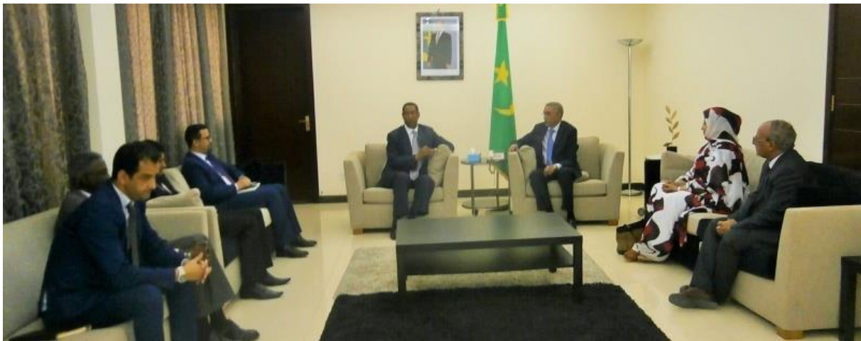
Audience accordée par le Premier Ministre aux membres du Comité National ITIE le 17/05/2016

Par rapport aux activités ci-dessus, nous pouvons affirmer que la performance est acceptable.