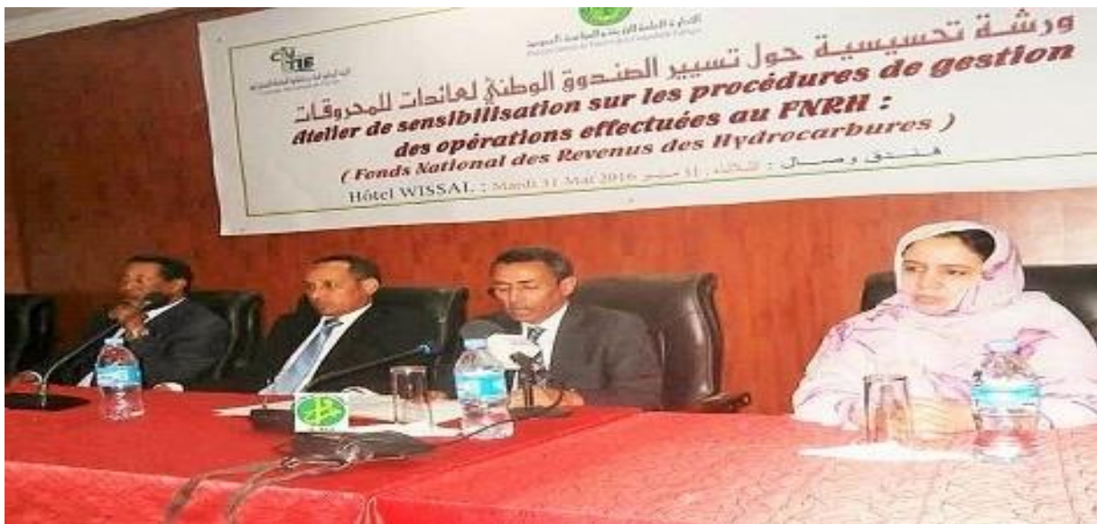
Atelier de sensibilisation sur les procédures de gestion des opérations effectuées par les opérateurs pétroliers sur le FNRH organisé le 31 mai 2016 à Nouakchott