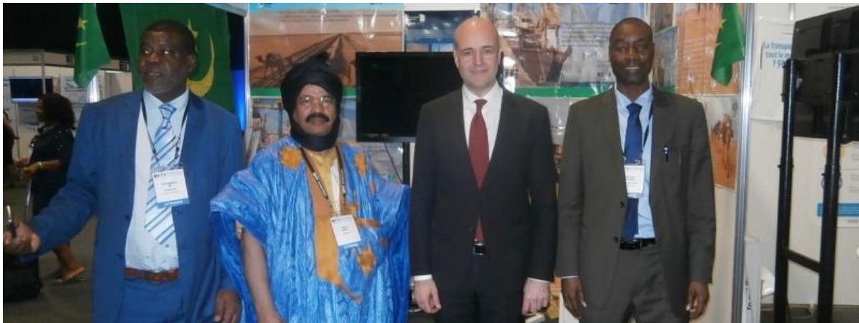
Visite de son Excellence monsieur Fredrik Reinfeldt, Président de l'ITIE international, au stand du Comité National Mauritanie lors de la conférence mondiale de Lima (Pérou) en février 2016

On se limitera ici exclusivement aux recommandations précédentes en raison de leur spécificité. Elles sont, en effet, formulées par l'Administrateur indépendant à travers le rapport de conciliation des chiffres et des volumes des industries extractives conformément aux orientations de la Nouvelle Norme ITIE. Ensuite, elles ont été compilées à travers une matrice par l'équipe du Secrétariat technique ITIE qui les a soumis à la discussion et à l'approbation du Comité National ITIE.