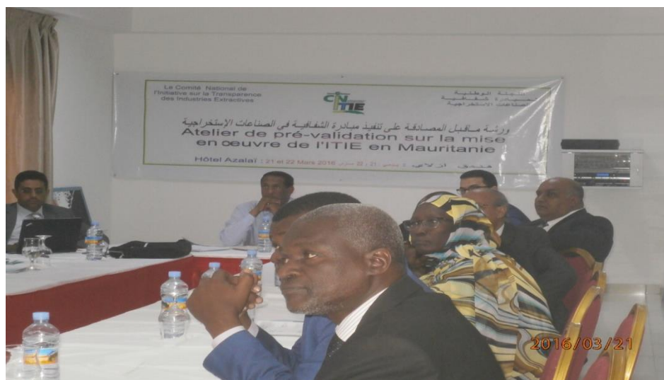
Vue des participants