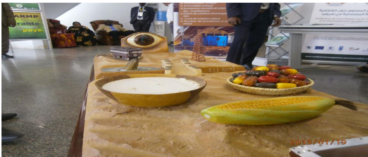
Maquette descriptive des objectifs socioéconomiques de l'ITIE

Ce rapport sera mis à la disposition du public à travers le site du Groupe Multipartite www.cnitie.mr .