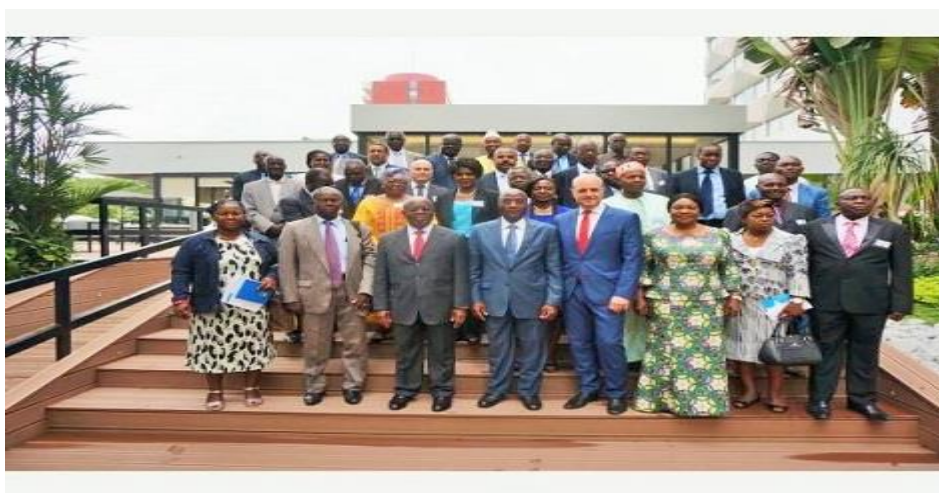
Vue des participants lors de la semaine de formation ITIE en Afrique francophone

L'objectif de ce rapport annuel d'avancement est de fournir au public des informations susceptibles de l'édifier sur les différentes étapes de la mise en œuvre du processus ITIE au cours de l'année 2015. Il lui permet aussi de mieux apprécier la pertinence et l'efficacité des actions mises en œuvre en 2016.