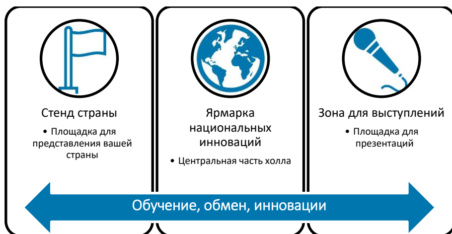
Рис. 1: Составляющие Ярмарки национальных инноваций 2019 г.